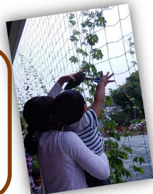
昨年の収穫の様子

ゴーヤの実ができれば、収穫体験しましょうね。※収穫体験の日程は決まり次第告知します